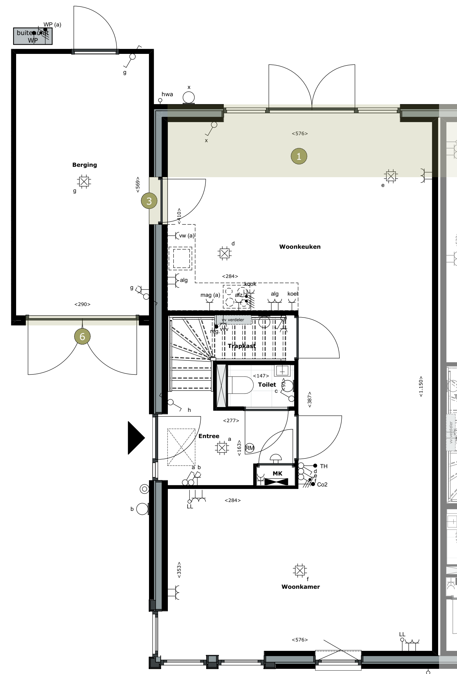
00 begane grond