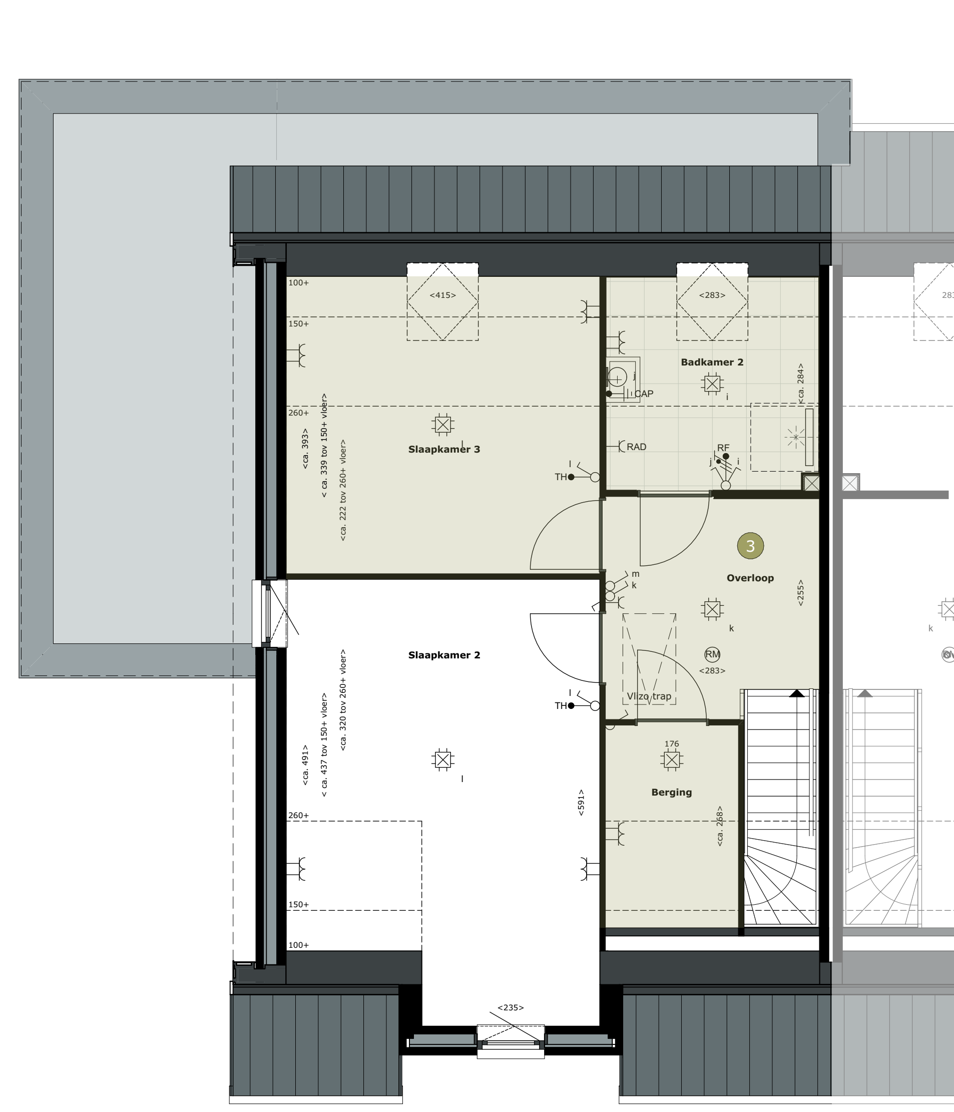
01 eerste verdieping