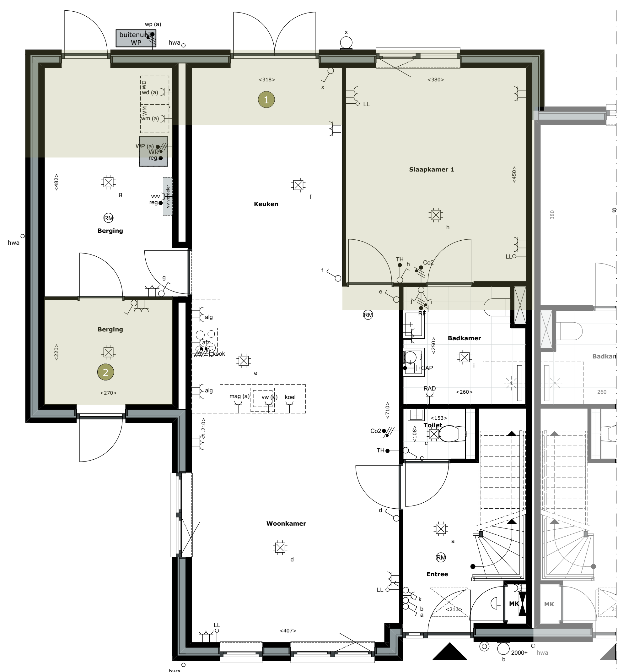
00 begane grond